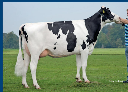
MMM: Snowman Sanderij Massia Sneeuw witje VG-89