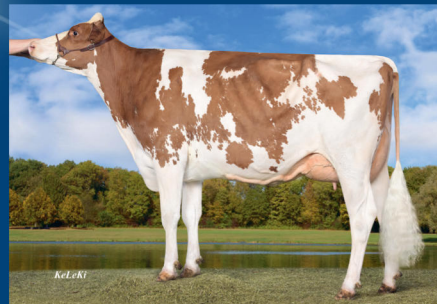
MM: WIL Smile Brekem VG-85