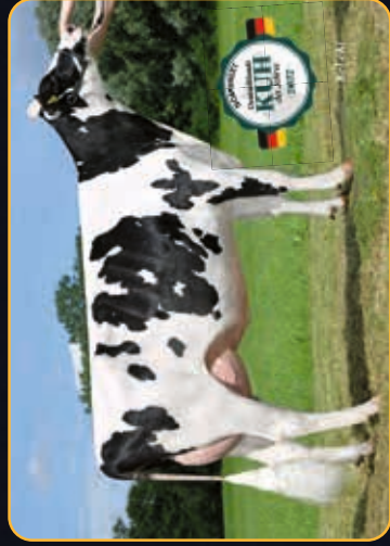
THI XILLY VG-BB