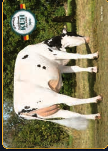
HUL-STEIN RUW AMERIKA P GP-B4