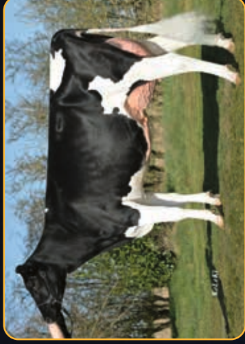
AMALEA IHDE MS PADAWAN AMGI VG-B7