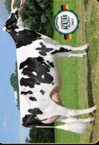
THI XILLY VG-BB

NIEDERRHEINHALLE KREFELD 10 UHR | ONLINE-BIETEN MÖGLICH