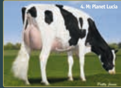
4. M: Planet Lucia

Was für eine Gelegenheit, ihre Chance auf eine fantastische DIREKTE Tochter der wohl besten roten Schau & Zuchtkuh die es jemals gab: KHW Regiment Apple EX-96-USA