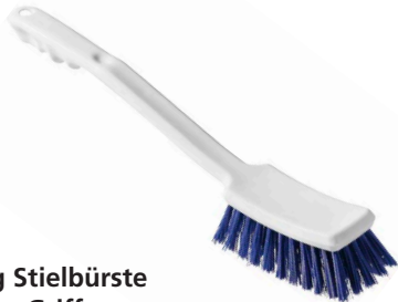
Haug Stielbürste langer Griff