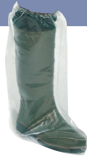
Überschuhe mit Gummizug

91262-01-## 1 Pkg 17,80 € 0,18 €/1 Stk ab 10 (einer Größen) Pkg 16,80 € 0,17 €/1 Stk