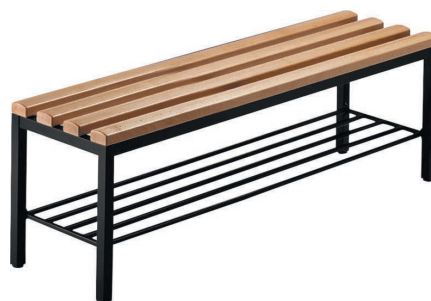
Freistehende Sitzbank mit Schuhrost