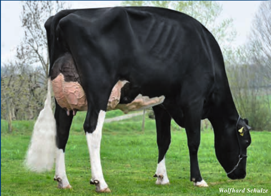
VS zu Rocher: Mox Raja VG-89