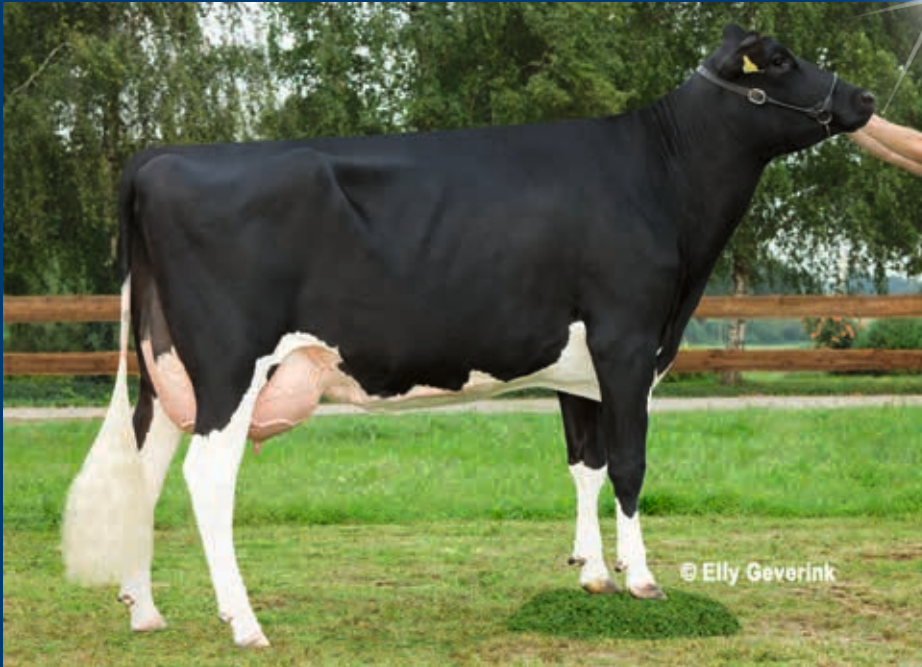
MMM: PH Antje VG-88