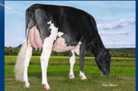
M: MS Licorice GC Lovely VG-88