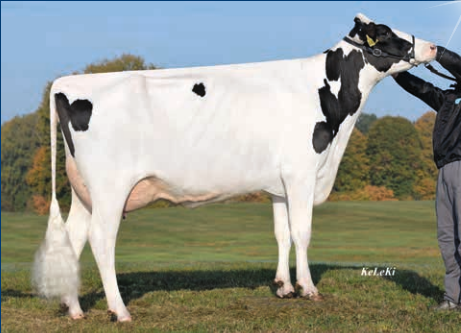
MM: HFP Queenly VG-85

geboren: 28.08.2019 Verkäufer: Ludger Sondermann, Bocholt