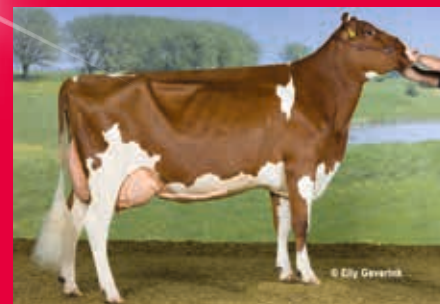
MM: Maren VG-89