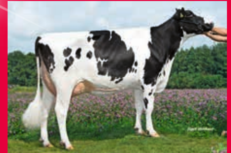
VS der M: WIL K 41 VG-87