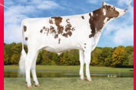
V: Spark Red