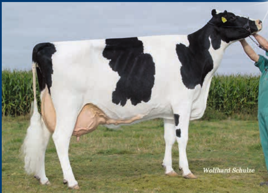
M: KNS Daybright EX-91