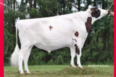
V: Arino Red