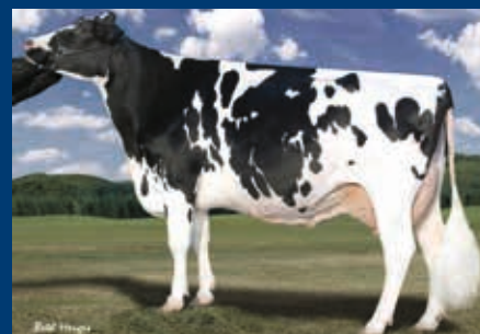
5. Gen.: Larcrest Outside Champagne EX-90