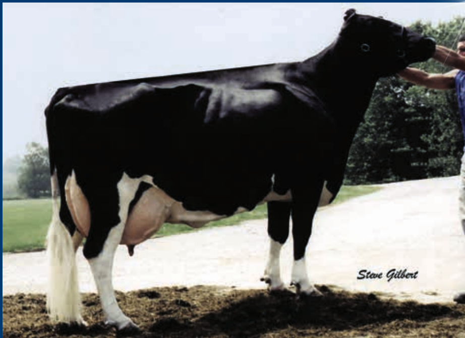
Stammkuh: Wesswood HC Rudy Missy EX-92