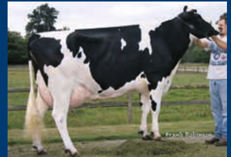
5. Gen.: Ronelee Outside Dabble-ET EX-91