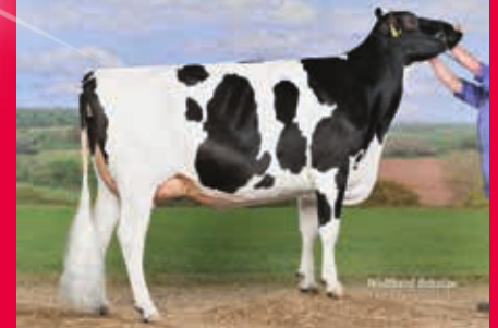
MMM: KNS Dalisto VG-86