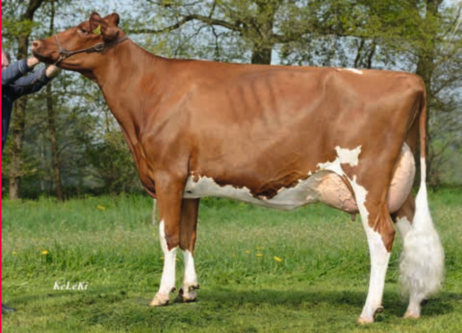
M: Laura Red VG-85

geboren: 16.10.2017 gekalbt: 25.11.2019 Verkäufer: Koester KG, Steinfurt