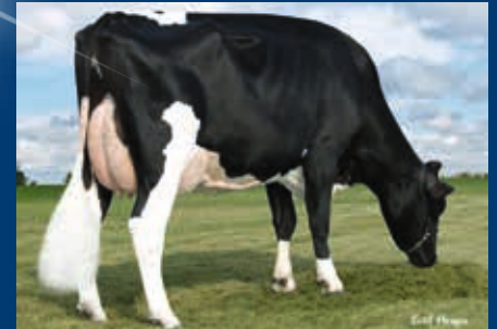
MMMM: Boliver Ronelee Dreary-ET VG-86