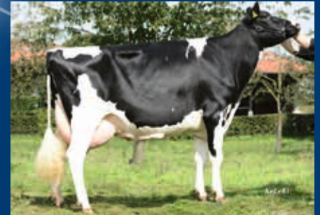
MMM: PH Akazie EX-90