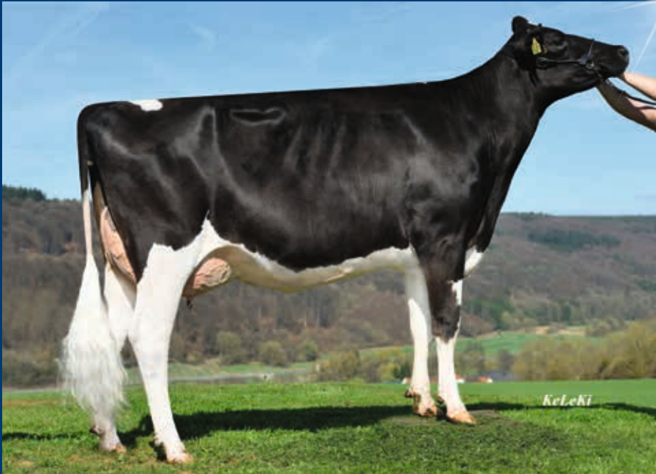
MM: NH Marilyn 747 VG-86