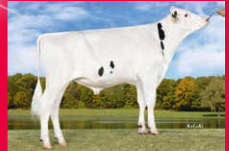
V: Gywer RDC