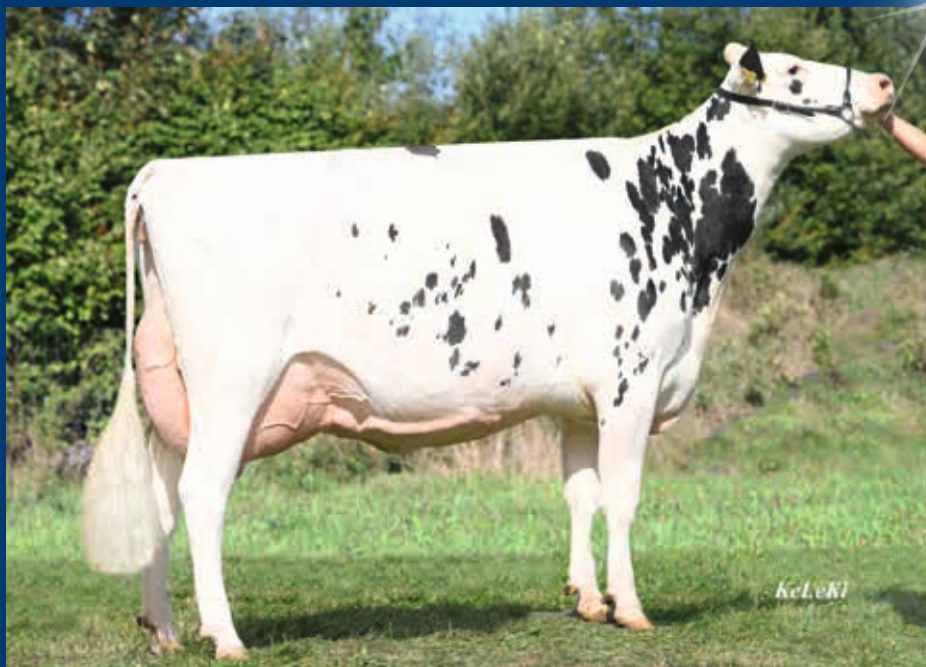
MM: Barbie EX-91