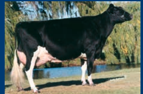
MMM: Krull Broker Elegance EX-96