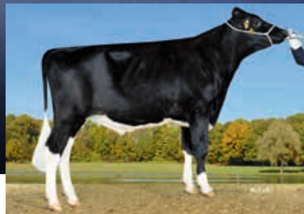
Anton x VG 85 Sudan x VG 88 Freddie