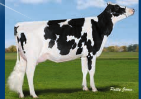
4. Gen.: Gen-I-Beq Snowman Summer VG-85