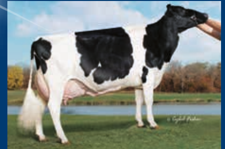
MM: Budjon-JK Linjet Eileen EX-96