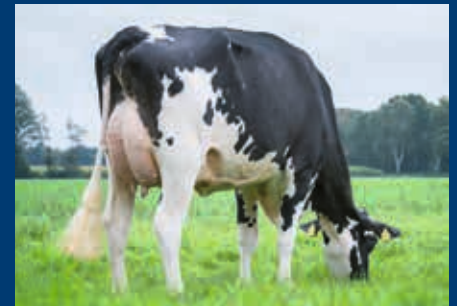
HS zur So Lovely: Blondin Doorman Laola VG-86

+ Lovely wurde für 41.000 $ verkauft. Sie stammt aus der gleichen Familie wie Idee Lustre EX-95, dem Grand Champion der RoyalWinter Fair 2002