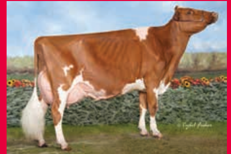
MM: Wilstar-RS TLT Limited EX-94