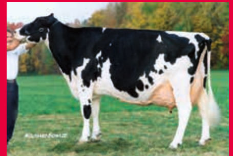
Stammkuh: Stookey Elmpark Blackrose EX-96