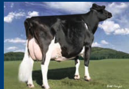
Stammkuh: Regancrest PR Barbie EX-92

+ Großmutter Barbie war Reservesiegerfärse der RUW-Schau 2015 und Grand Champion bei der Bezirkskuhschau des Rhein-Sieg-Kreises