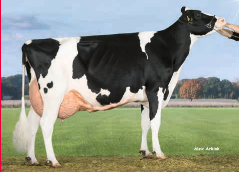
MM: ETG Security 25 EX-91

Verkäufer: Effing Timmermann GbR, Vreden