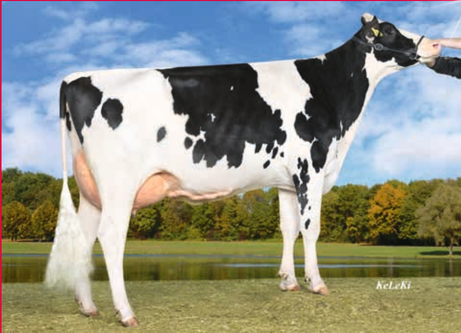
M: WIL Kira VG-86