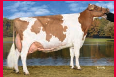
VS der M: WR Bacardi EX-91