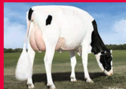
6. Gen.: Des Y-Gen Planet Silk-ET EX-90