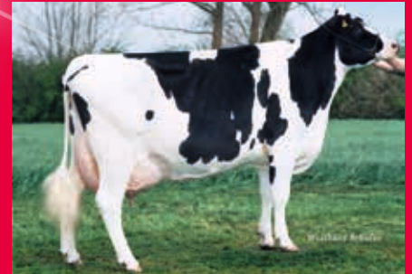
4. Gen.: THI Stardust Blackflower EX-91