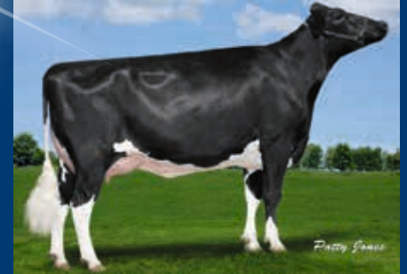
MMM: Aija Supersire Makea VG-86