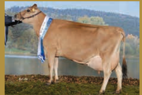
MMMM: WIT Dagmar EX-90