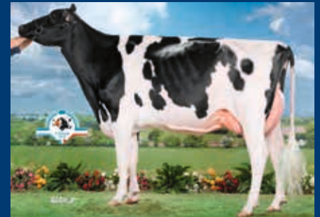
Hermine Tual EX-94 - Gold Chip Tochter aus der gleichen Kuhfamilie