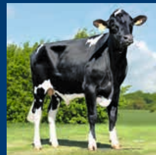
V: Mission P RDC