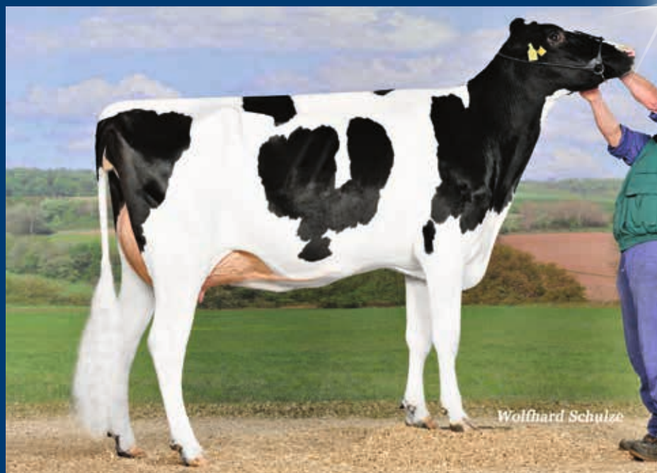
MM: KNS Missbalista P RDC GP-84