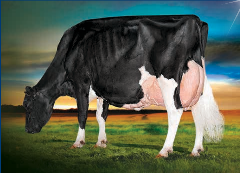
MM: Ocean-View Damion Elise EX-94-2E-USA