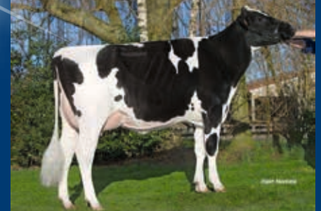
MMM: Roccafarm Beacon Chrissy VG-87