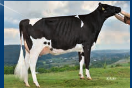
MMM: Vekis Mellow VG-88