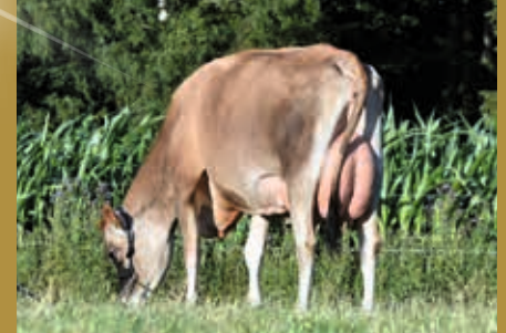
Tochter von GNH Naomi: GNH Namika VG-86