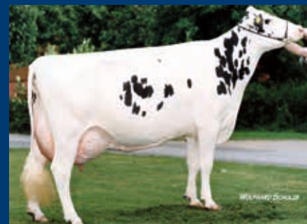
MMM: KNS Dorfgirl EX-93