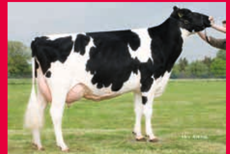
5. Gen.: Holbra Mascol Pam VG-87