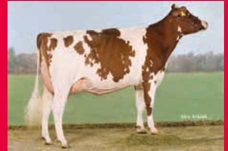
HS der M: WIT Geraldine EX-90