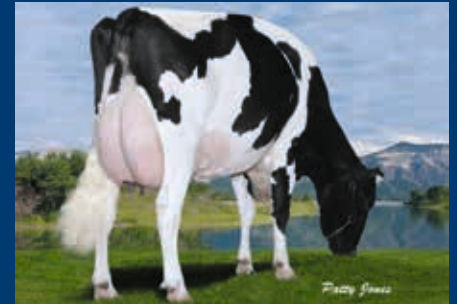
6. Gen.: Gen-I-Beq Goldwyn Secret VG-87