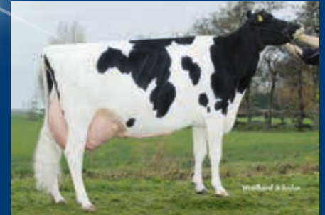
MM: ViG Perle EX-93