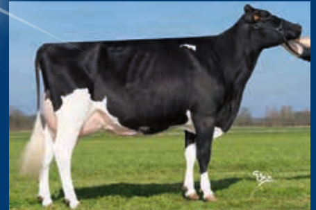
4. Gen.: Bontemps Goldwyn Belfast RDC VG-87