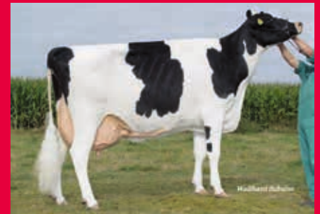
Stammkuh: KNS Daybright EX-91