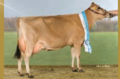
MMM: WIT Dalia EX-92