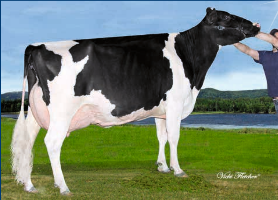
M: Budjon-JK-I-Dundee Endless EX-92