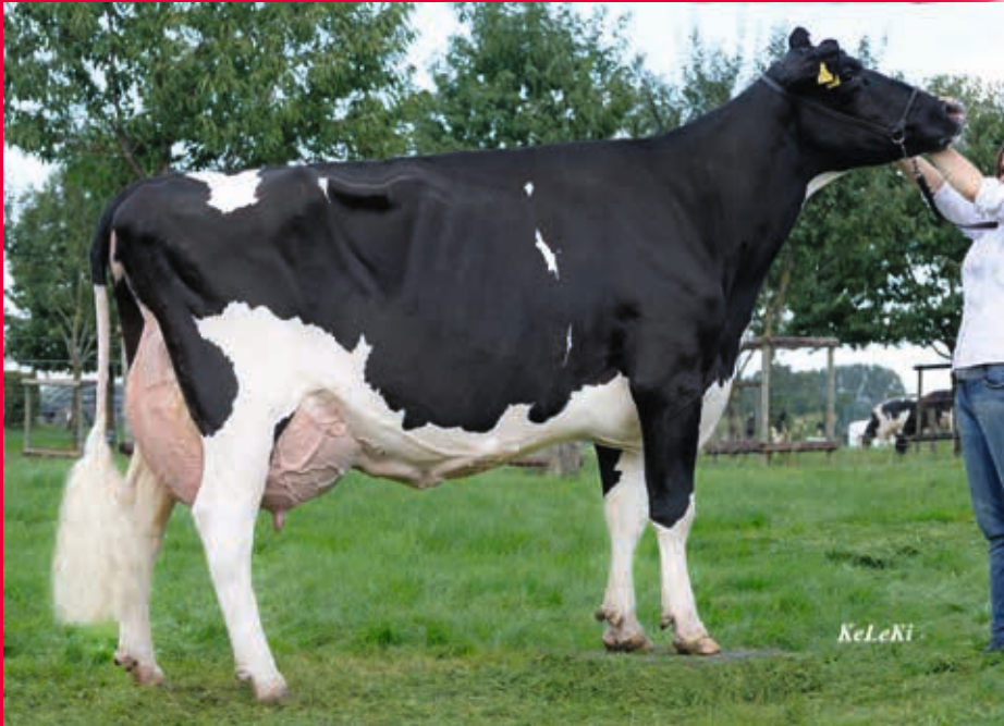
MMM: THI Blacktalent EX-90