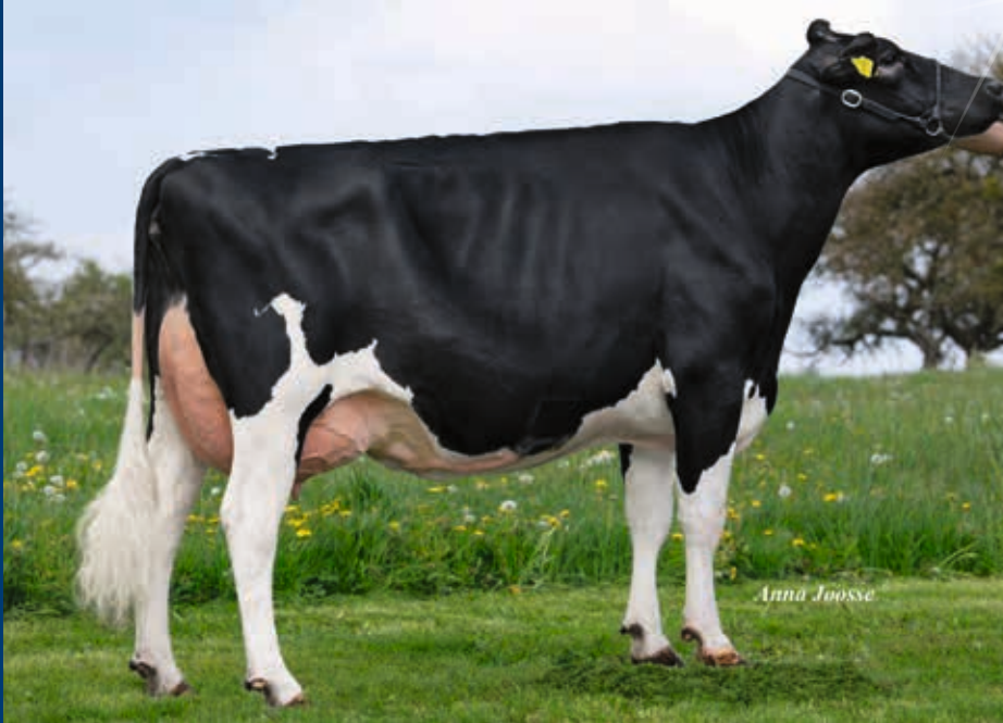
MM: Mackenzie 1363 VG-87