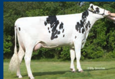
5. Gen.: Tir-An O Man Neblina VG-87