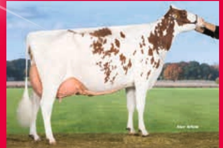
HS der M: WR Brandy EX-92