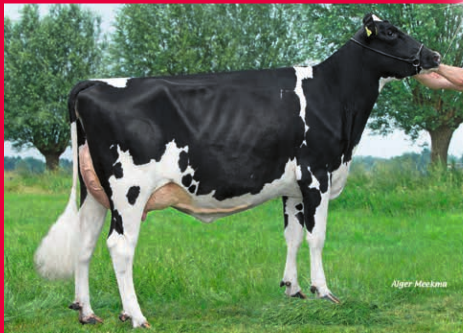
MM: WIL Kalibra RDC VG-86

Verkäufer: GenHotel B.V., Heino, Niederlande