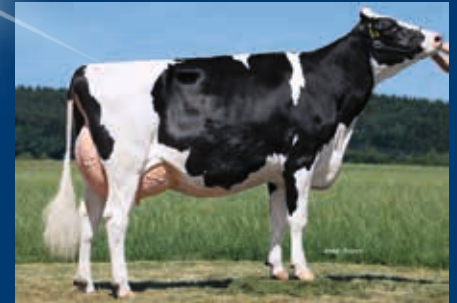
PM Carmel - Defender-Tochter aus der gleichen Kuhfamilie