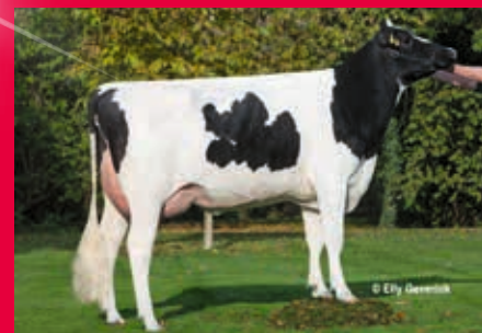
VS zur M: RUW Silvia RDC VG-85