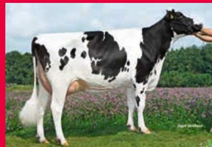
HS zur MM: WIL K 41 RDC VG-87