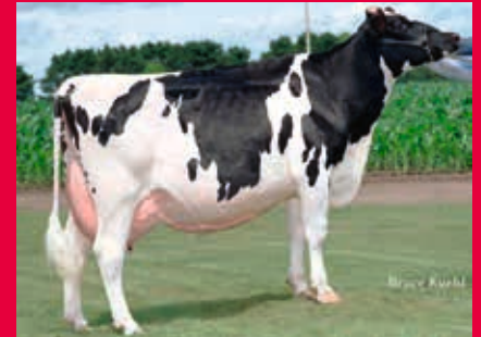
Stammkuh: Ralma Faith Juror EX-91