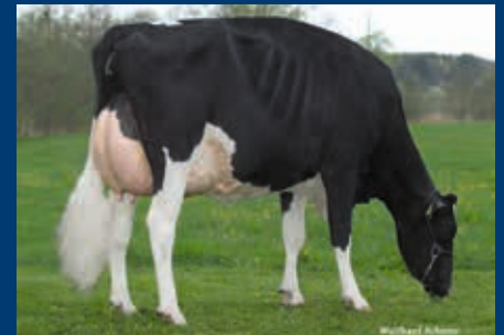
MM: Kerndtway Goldwyn Ranya EX-90

+ Sehr schöne Diamondback RDC-Tochter mit 10 Generati- onen EX-Müttern