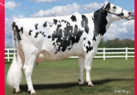
5. Gen.: Langs-Twin-B C-S Ashlyn EX-90