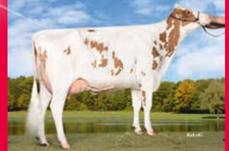
MMM: WIL K25 VG-88