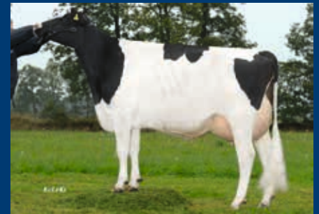
MMMM: HFP Queenie VG-88