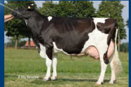
MM: Linda VG-89