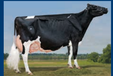
MM: Ocean-View Damion Elise EX-94-2E-USA

+ Leistung und Showstyle mit nordamerikanischen Wurzeln