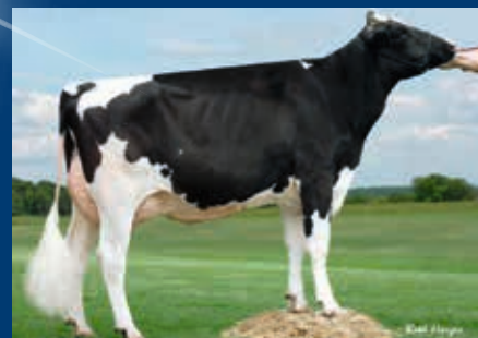
MMMM: Larcrest Chenile VG-86