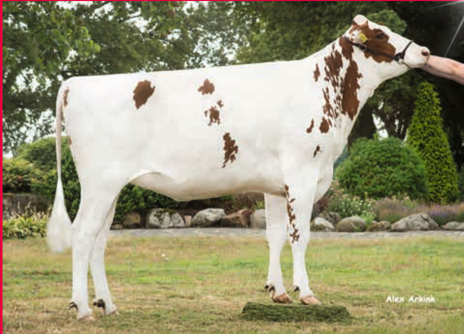
M: K&amp;L Sv Sunny RED

Verkäufer: GenHotel B.V., Heino, Niederlande