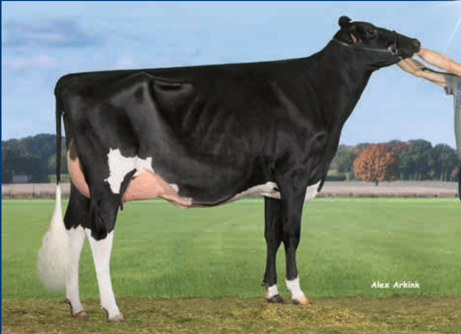
M: DS Nebra VG-87