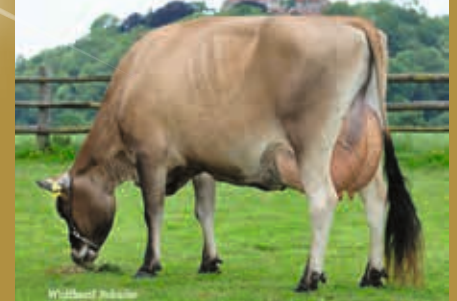
MM: AS Evett PP EX-90