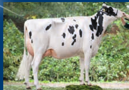
M: THL Pitu VG-87