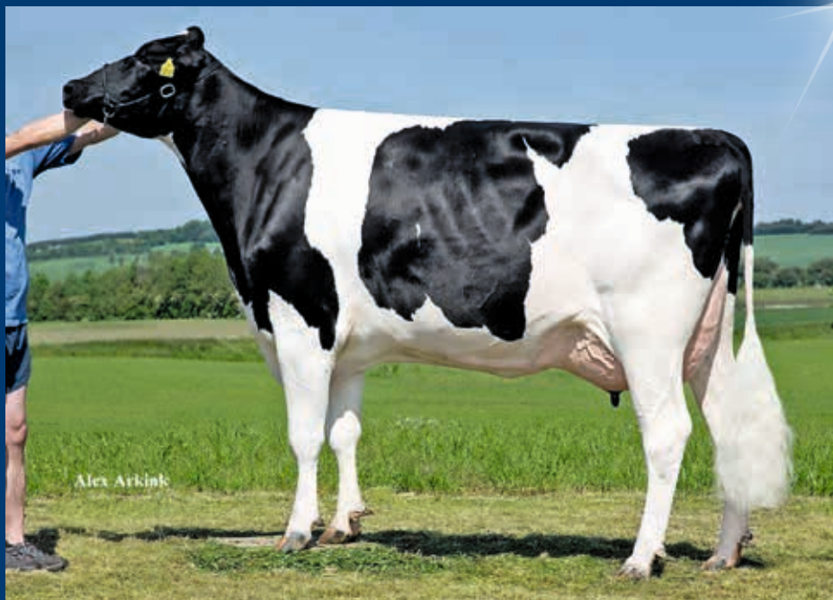
MMM: Tirsvad BT Noma VG-89