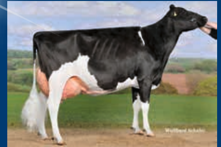
M: Mox Rihanna EX-93