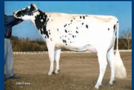
6. Gen.: Carters-Corner Shot Melody EX-90