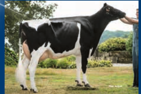
MM: Maybelline VG-85