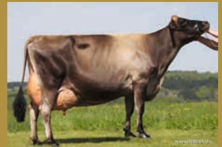
MMM: Evita EX-91