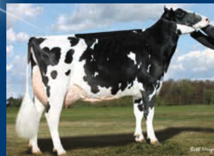
4. Gen.: Regancrest Belara-ET EX-94