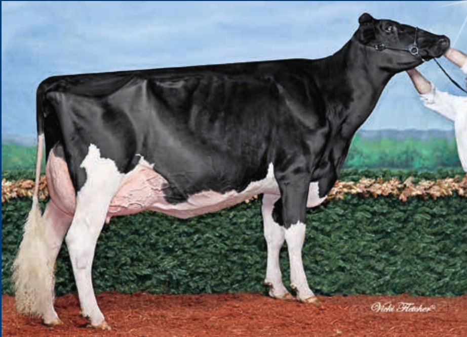
MM: Rockymountain Talent Licorice RDC EX-95