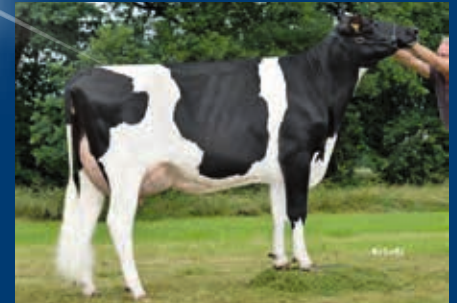
MMM: HF Queenena VG-85