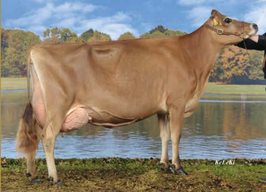
M: WIT Damaris EX-90