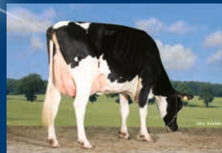
4. Gen.: Tirsvad Stol Joc Nemo VG-87