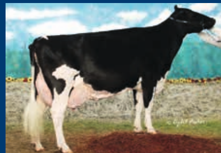
Stammkuh: Windy-Knoll-View Promis-ET EX-95-2E