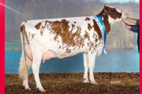
MM: WIT Geraldinchen EX-91