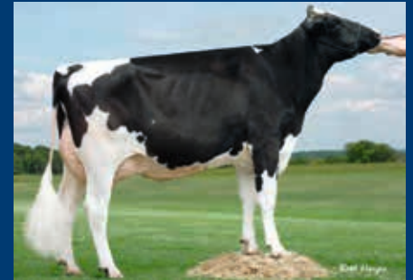
4. Gen.: Larcrest Chenile VG-86

Stammkuh: Larcrest Outside Champagne EX-90