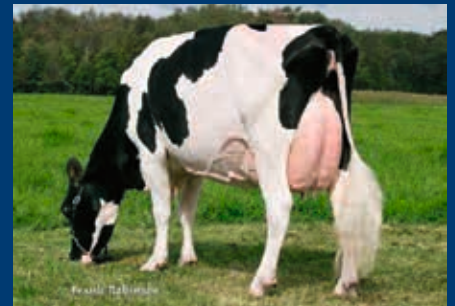
5. Gen.: Gen-I-Beq Durham Sunshine VG-88