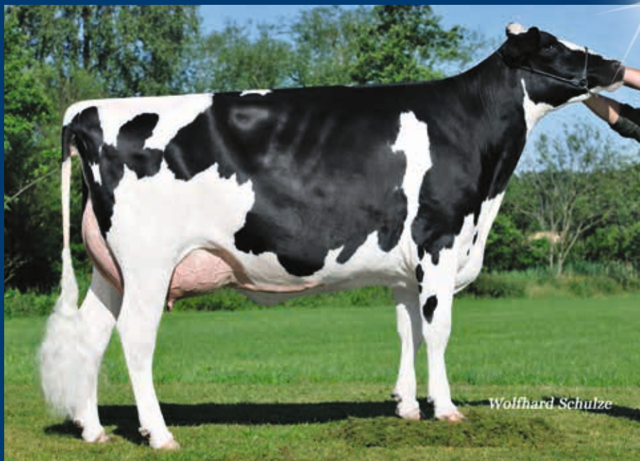
M: Regancrest-UR Bluestar EX-92