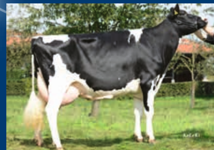
MMM: PH Akazie EX-90