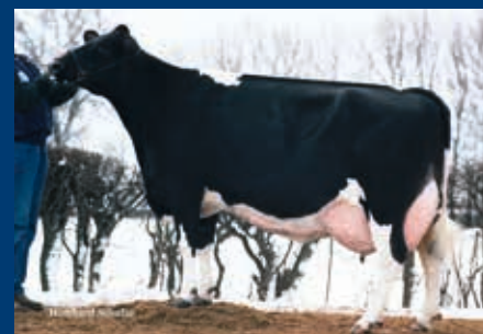
Stammkuh: Blackstar Mabel VG-88