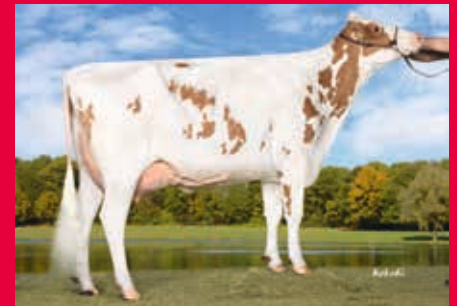
MM: WIL K 25 VG-88