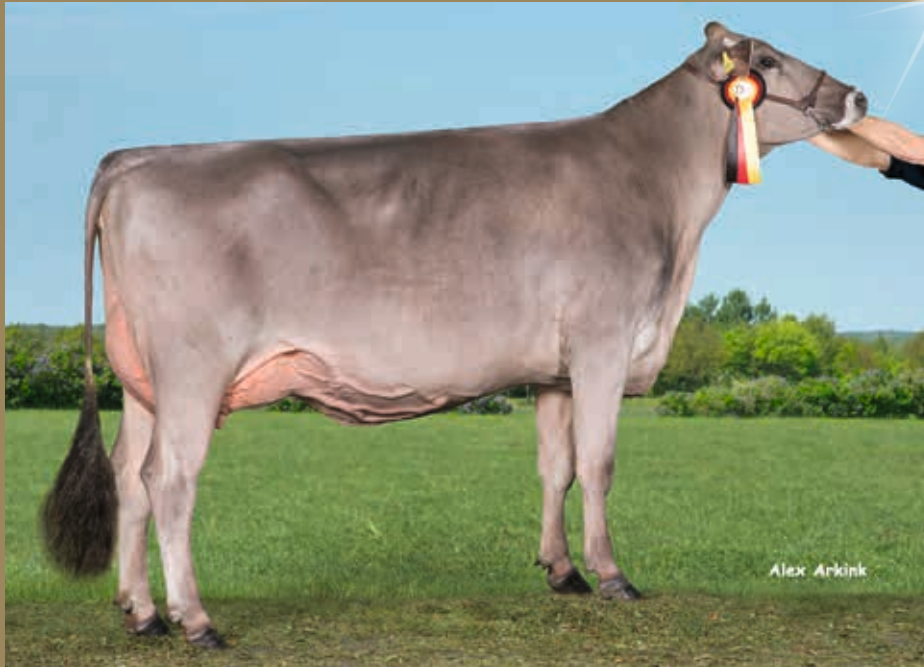
M: Uganda VG-85