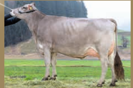
MM: Uschi GP-84