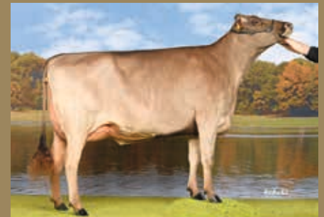
VS der M: Uruguay