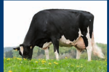
MMM: AHA Carla EX-95