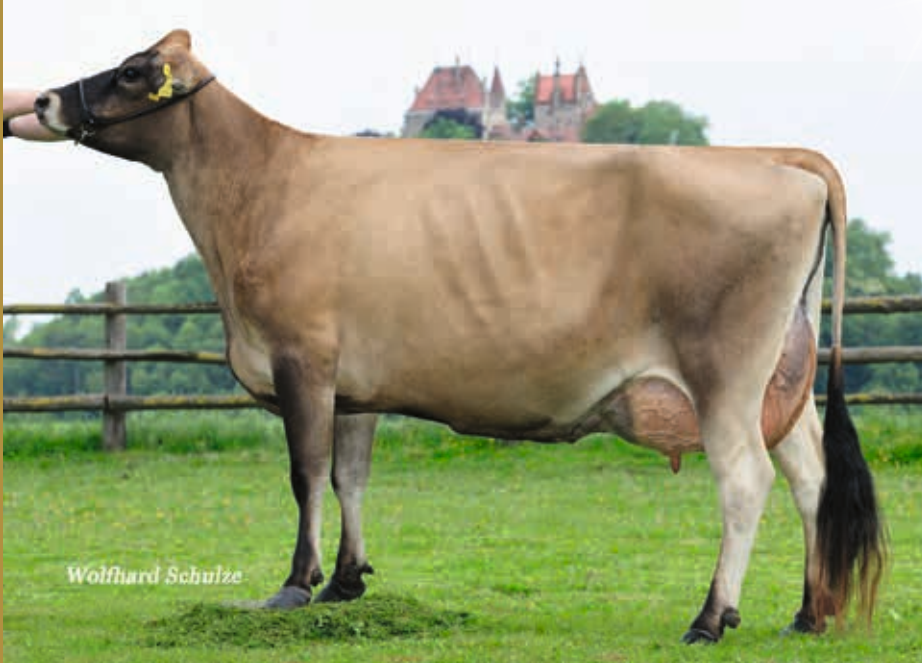
MM: AS Evett PP EX-90