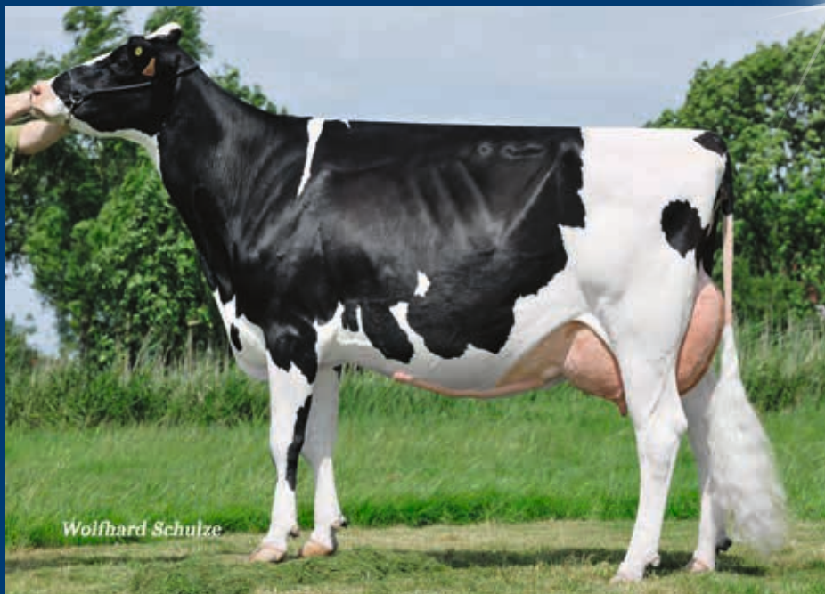
M: Lara Rae EX-90