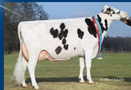
HS zur MM: KNS Dorflady EX-92