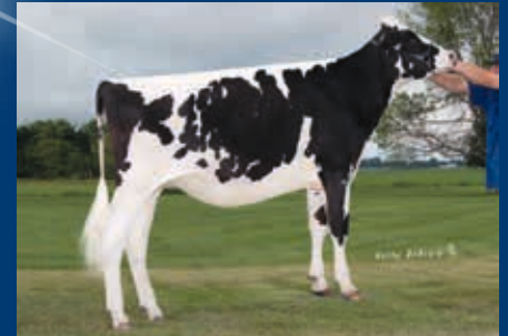
M: Ocean View Shocking Elektra