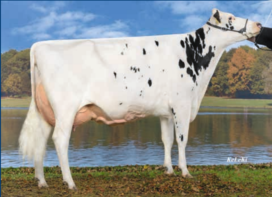
M: Loreley 176 EX-90