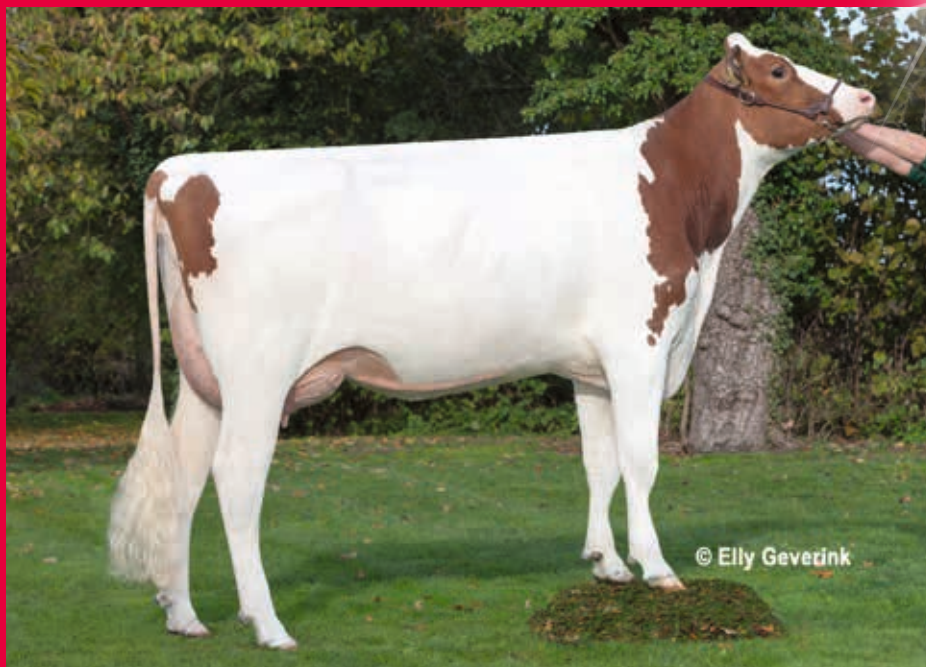
M: RUW Syvana Red VG-85