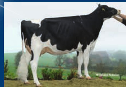
VS zur M: Regancrest Sanchez Bluepearl VG-85