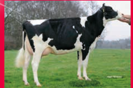
MMMM: Holbra Manoa VG-85