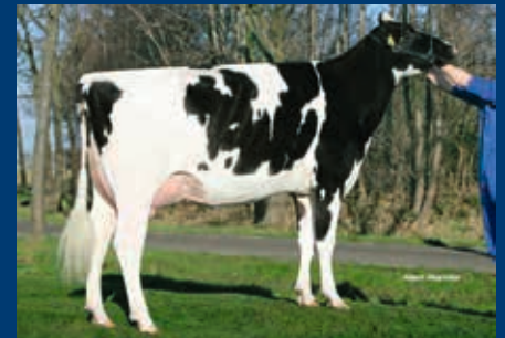
4. Gen.: Vekis Xaco Melody