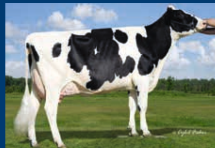
MMMM: Welcome Bolton Gina VG-86