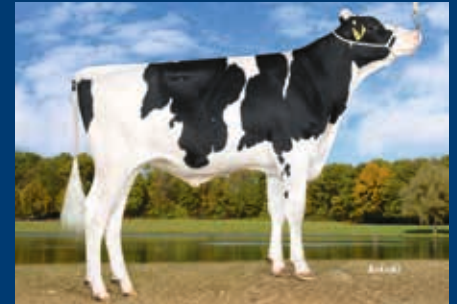
Benz-Halbbruder zur Mutter: RZN Backfield RZG 157