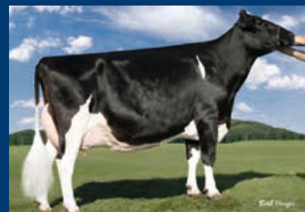
Stammkuh: Regancrest PR Barbie EX-92