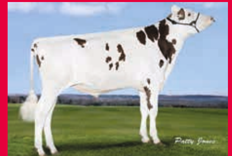
MV: Westcoast Styx Red