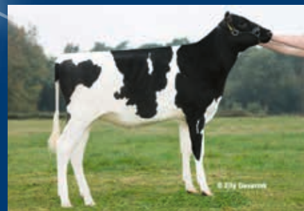
HS zur M: Torrie