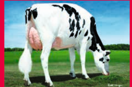
Dymentholm Sunview Sunday RDC VG-87 - aus der gleichen Kuhfamilie