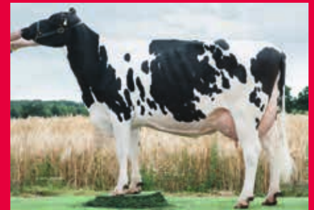
MMMM: WIL Kanu RDC VG-88