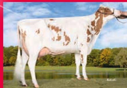
MMM: WIL K25 VG-88