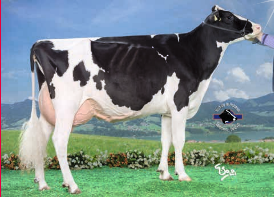
M: WIT Gerti EX-90