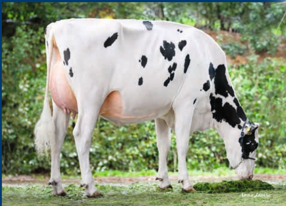
M: THL Pitu VG-87