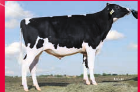
V: My Dream P