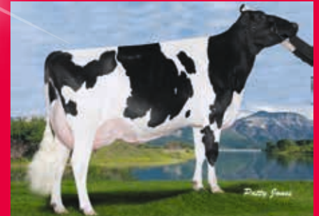
Gen-I-Beq Goldwyn Secret RDC VG-87 - aus der gleichen Kuhfamilie