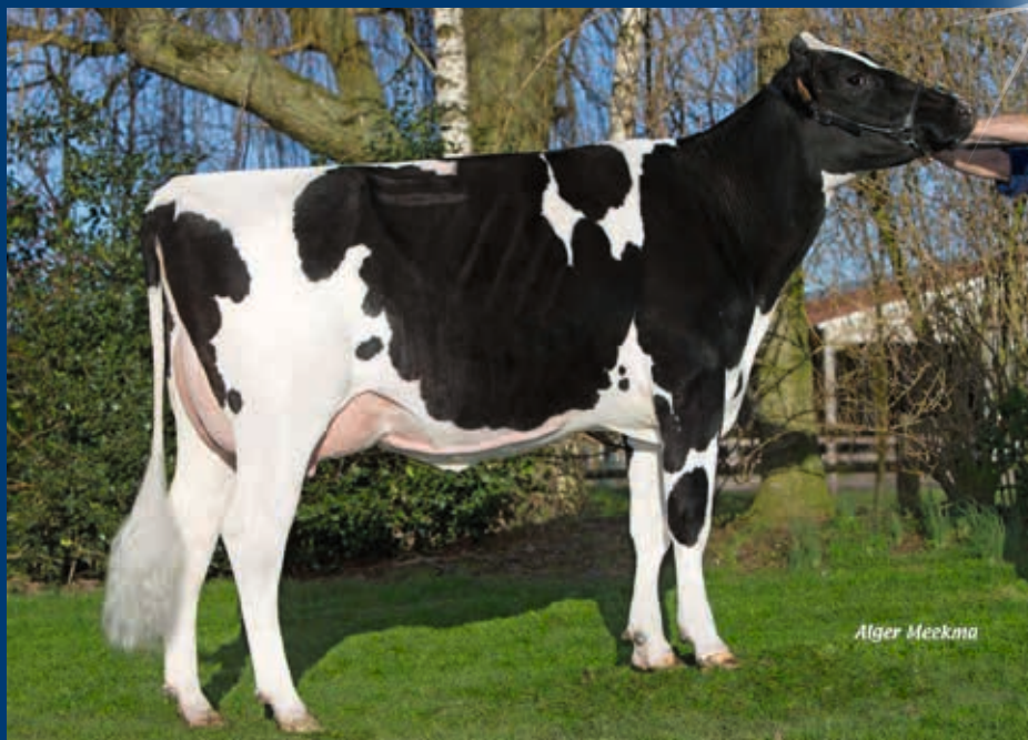
MMM: Roccafarm Beacon Chrissy VG-87

Verkäufer: Hurkmans, Milheeze, Niederlande