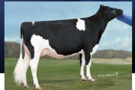
MM: Vieuxsaule Freddie Tanya VG 88