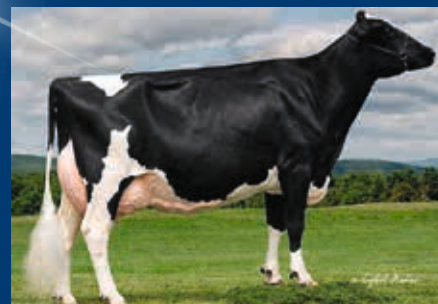
MM: Gloryland Lana Rae EX-94