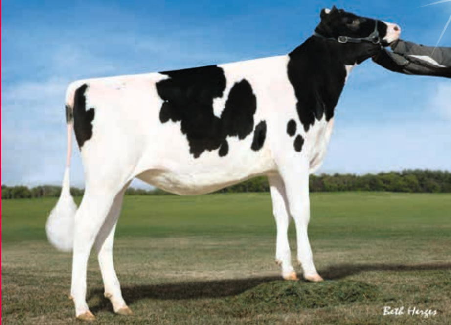
MMM: EDG Christa Mogul 2080