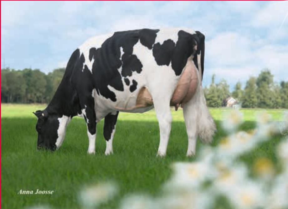
MM: De Oosterhof DG Rose RDC VG-87

Verkäufer: Koepon Genetics, Feerwerd, Niederlande