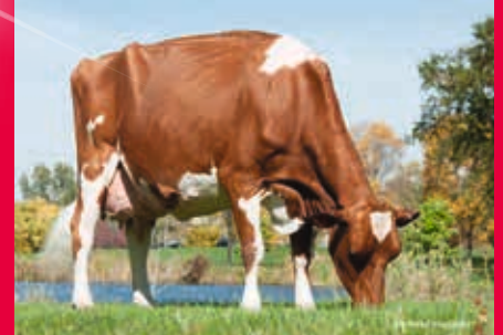
MM: Wilstar-RS TLT Limited EX-94