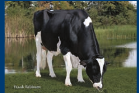
V: Maple-Downs-I G W Atwood