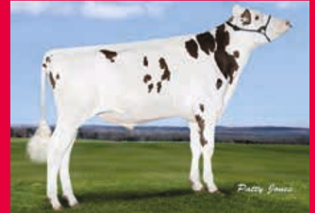
MV: Westcoast Styx Red