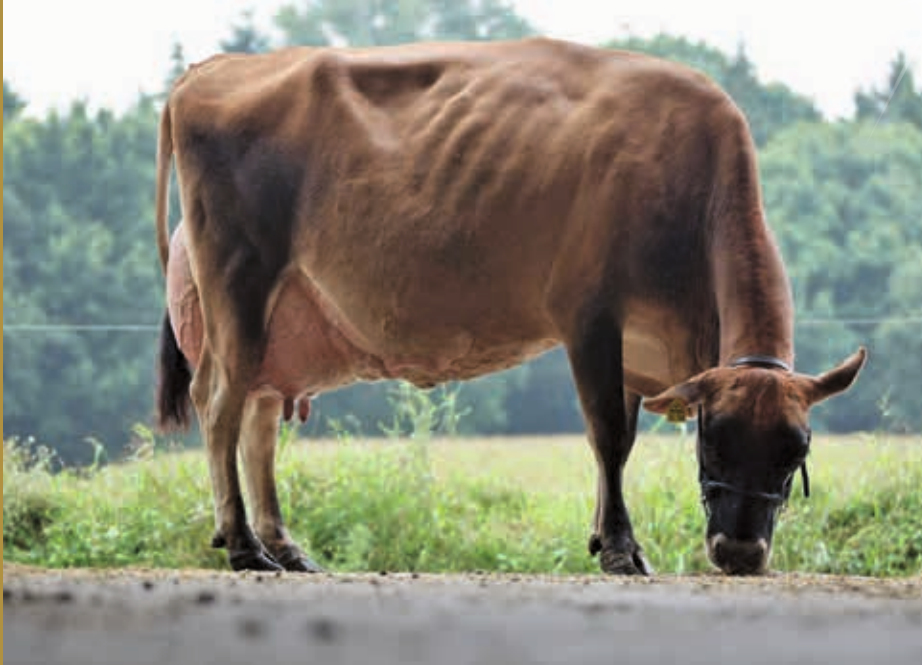
HS zur M: GNH Naomi VG-86