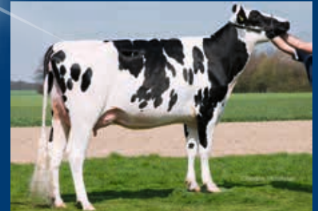
5. Gen.: Brookview RUW Super Melli VG-88