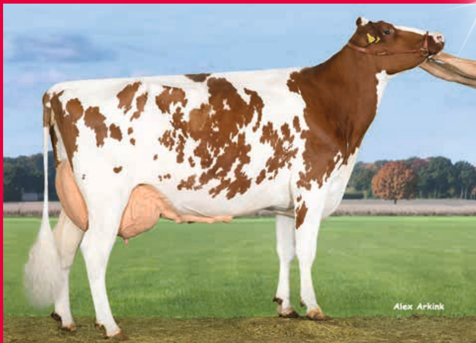
M: Marens EX-91