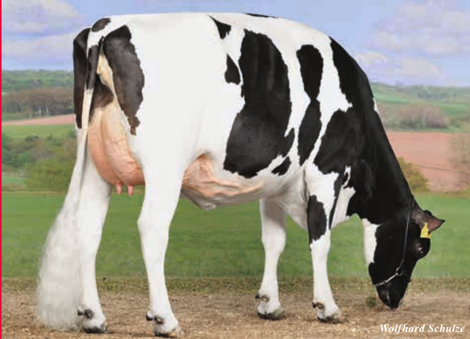
MMM: KNS Dalisto VG-86