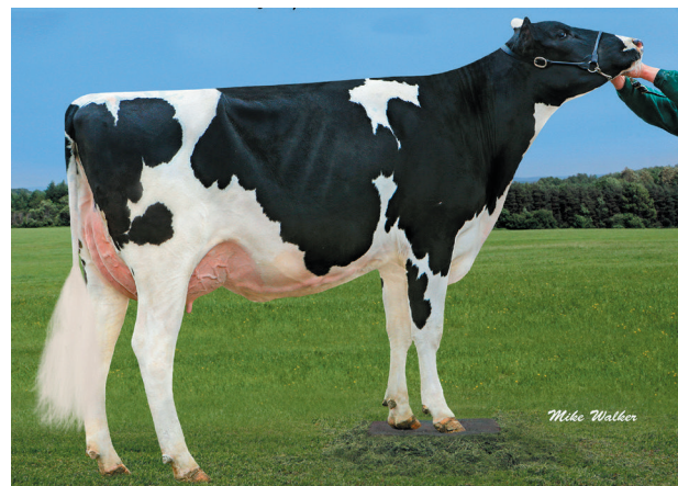
Sco-Lo-Kruse Dean Candy, Green-Banks Holsteins, South Dayton, USA