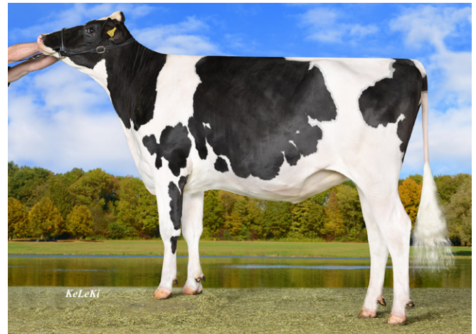
M: WIL Konzert, Wilder Holsteins, Vreden