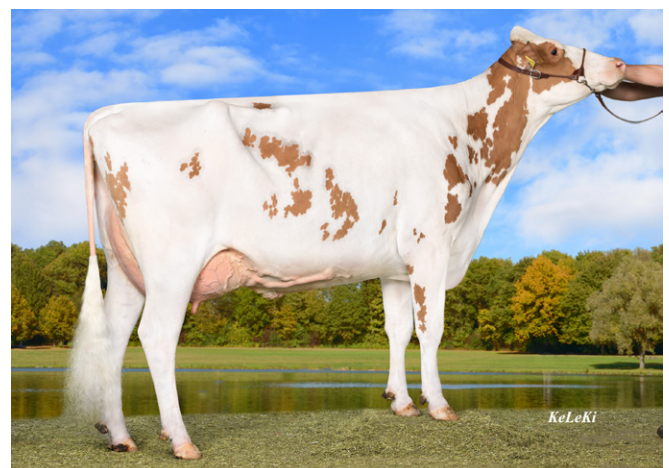
MM: Wilders K25, Wilder Holsteins, Vreden