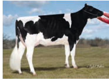
MMM: Springhope Observer Babs Springhope Holsteins, Stanley, USA