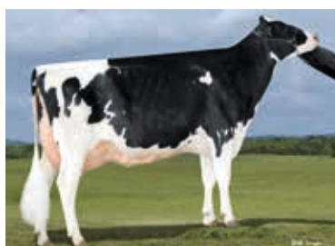
MM: Future-Jolane Uno Hay P, USA