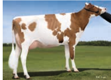
MM: Snowbiz Sympatico Sofia Red Snowbiz LG Rg., Kanada