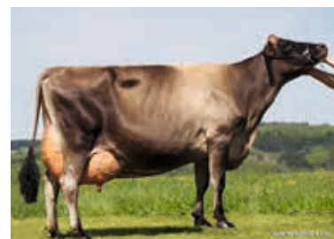
MM: Evita 234 EX 91 Agrarges. Schöbendorf, Baruth