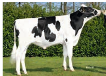
V: NUANCE RDC RUW