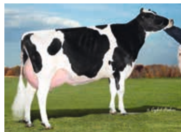
MMM: Cherry Crest Man-O-Man Roz Cherry Crest Holsteins, Paradise, USA