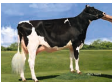
MM: Seagull-Bay Alexa One Seagull Bay Dairy, American Falls, USA