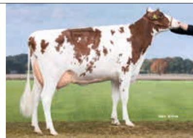
Chloe, Diehl GbR, Erzenhausen