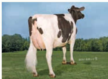
MMMM: Richmond-FD Pompey EX-91 v. Massey Aghavilly Holsteins, Lochmaben, UK